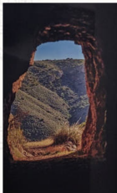
▲ Túnel Vía Vulcano

Todavía hoy, se pueden escuchar los sonidos de los trabajos mineros en La Mulata o en Vulcano; todavía hoy se oyen hablar a las familias de Serena, sobre las toneladas de hierro que iban a Garrucha; todavía hoy se ve a la gente volver desde otros lugares a sentir la experiencia de la minería de Bédar.