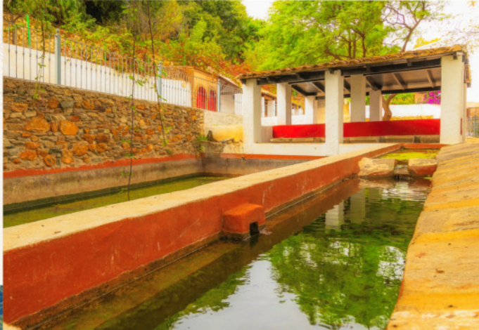
Lavaderos de Fuente Temprana ▲