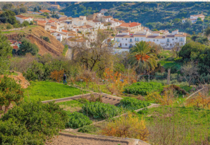
Vista general de la población de Bédar ▼