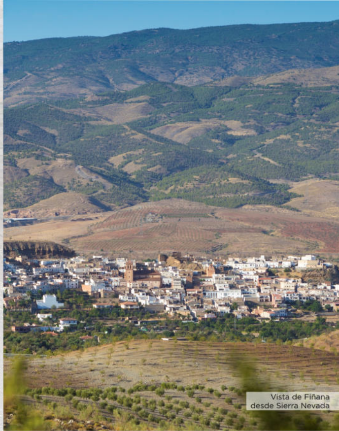
Vista de Fiñana desde Sierra Nevada