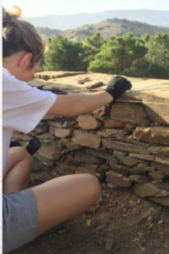
Construcción de muro en piedra seca ▲