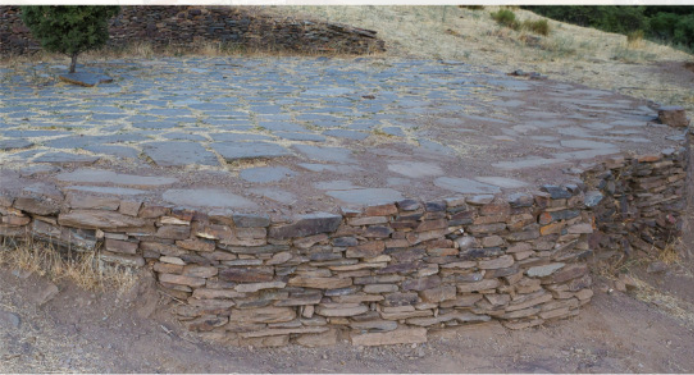
"Era" junto al refugio de Ubeire ▼

La principal roca del entorno que se utiliza para la "piedra seca", es el esquisto, pero en la zona la denominamos "pizarra". Aunque las dos son rocas metamórficas que provienen de la transformación de rocas de grano fino, los esquistos han sufrido mayor presión y temperatura que las pizarras.