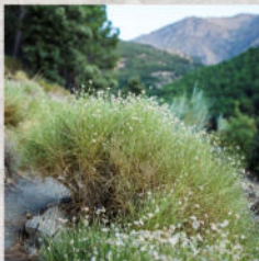
▲ Bolina ( Genista umbellata ) Endemismo ibero-norteafricano

El Centro de Interpretación del Medio Natural de Fiñana ofrece un viaje en el tiempo geológico, que comienza hace 20 millones de años cuando las rocas marinas formadas mucho antes, empiezan a sufrir mucha presión y temperatura, por el encuentro entre África y Europa, transformándose en unas rocas más duras y compactas que, hoy en día, constituyen las dos grandes sierras que lo rodea, Sierra Nevada y Sierra de los Filabres.