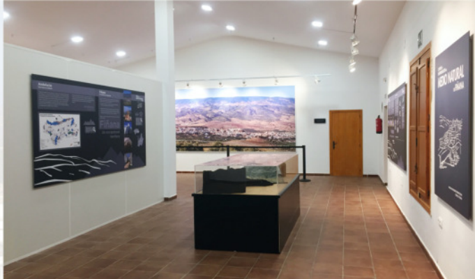
Vista interior del centro de interpretación ▲