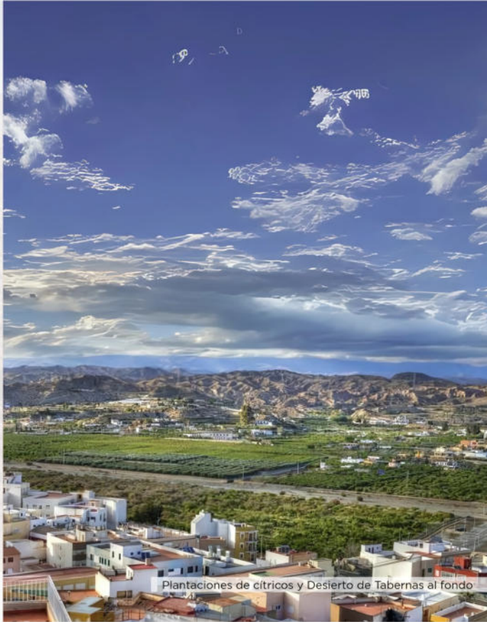
Plantaciones de cítricos y Desierto de Tabernas al fondo