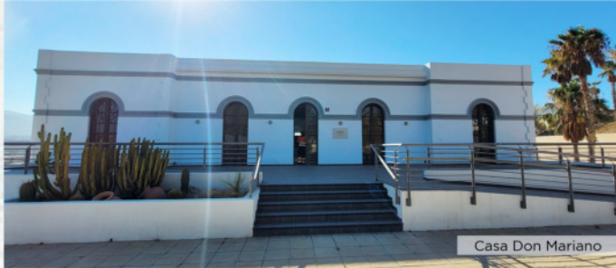
Casa Don Mariano