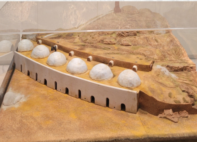
Recreaciones de construcciones mineras del azufre. Sala de la minería ▼

En el pasado, fue conocido como el "Molino rojo", cuando sus propietarios de la época decidieron crear un lugar de ocio y diversión que no llegó nunca a alcanzar la fama de su gemelo parisino.