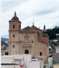
▲ Iglesia Parroquial Santa María (Gádor)