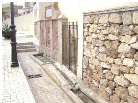
Fuente de los 4 caños

Una gran movilización solidaria permitió la llegada de ayuda directa a los afectados por el terremoto de mayo del año 2011.