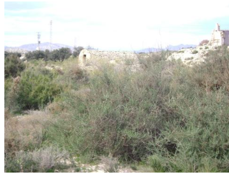
Aljibe de Cuesta Tita