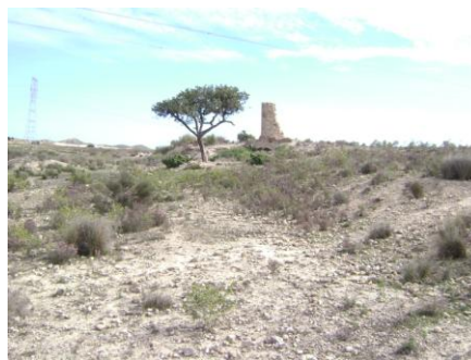
Molino de la Torrecica