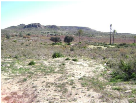
Aljibe de Fuensalida