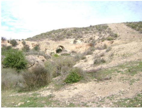
Acueducto del Roceipón