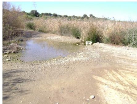
Charca del Roceipón