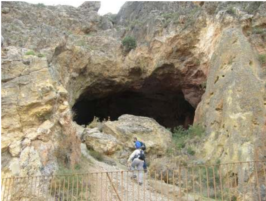
CUEVA DE LA PALOMA