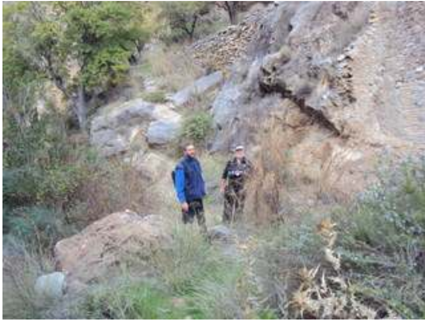
DOMINGO Y CARLOS POZO