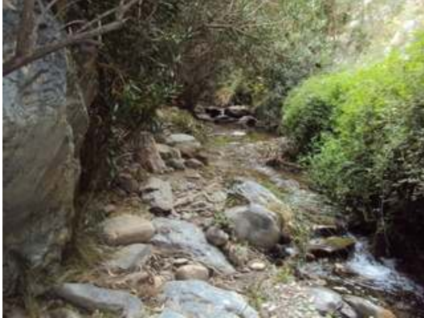
PARTE DEL CAMINO