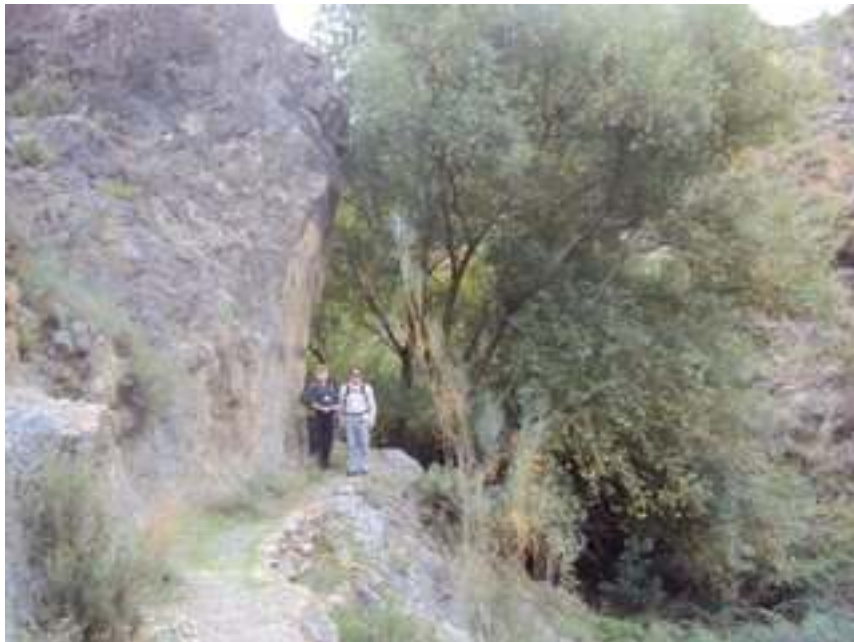
SUPERVISION DE LA RUTA