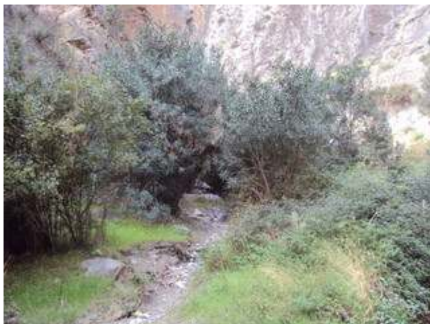
PARTE DEL CAMINO