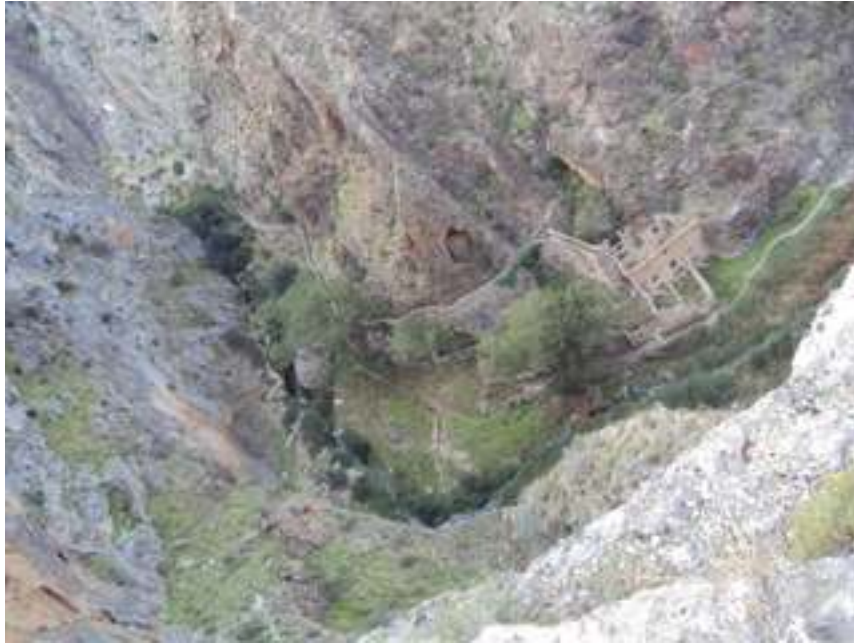
VISTAS DESDE EL PUNTO MÁS ALTO