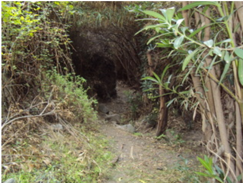
PARTE DEL CAMINO