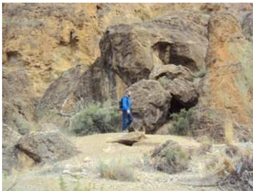
CARLOS POZO (TECNICO DEPORTES TIJOLA)