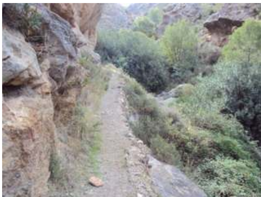
CAMINO DE LA RUTA