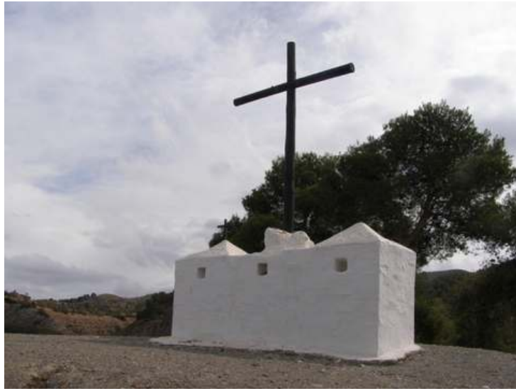
EL CALVARIO EN TIJOLA