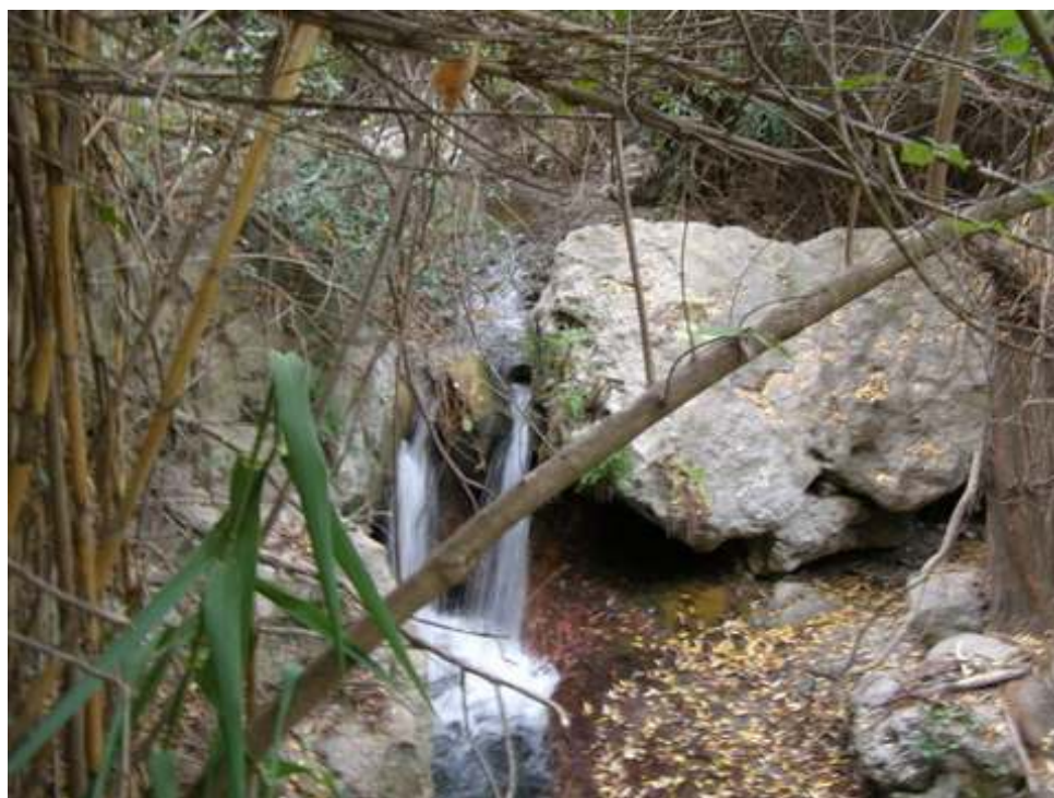
PARTE DE LA RUTA