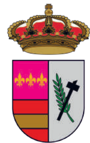
Ayuntamiento de Los Gallardos