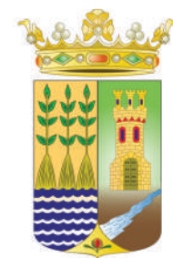
Ayuntamiento de Cuevas del Almanzora