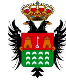
Ayuntamiento de Pulpí