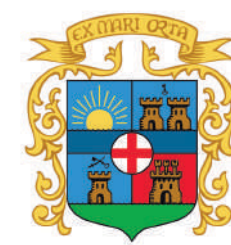
Ayuntamiento de Garrucha