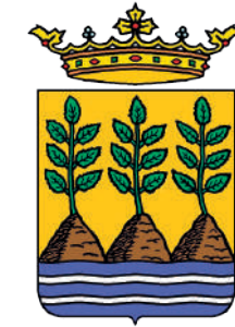
Ayuntamiento de Vélez Rubio