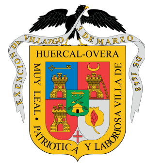
Ayuntamiento de Huércal Overa