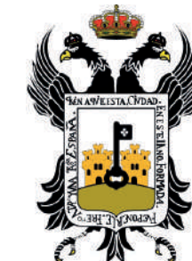
Ayuntamiento de Vera