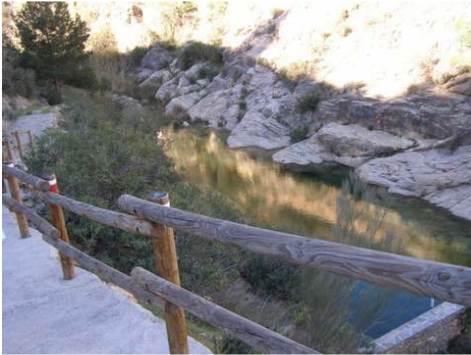
-PARTE DE LA RUTA-