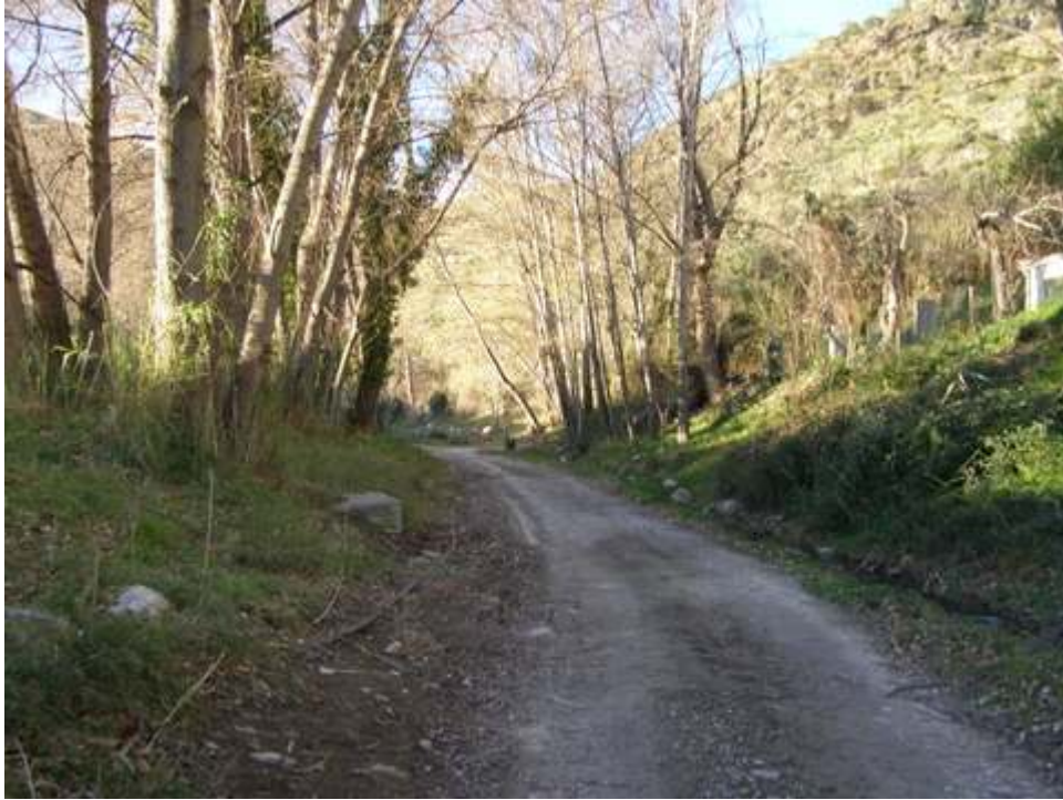
-PARTE DE LA RUTA-