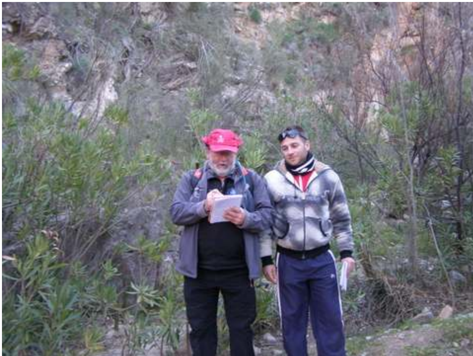
-SUPERVISIÓN CON DOMINGO Y CONCEJAL-