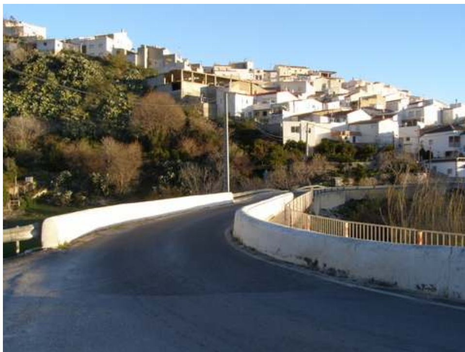
-PUNTO DE ENCUENTRO-